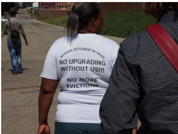
No Upgrading without us